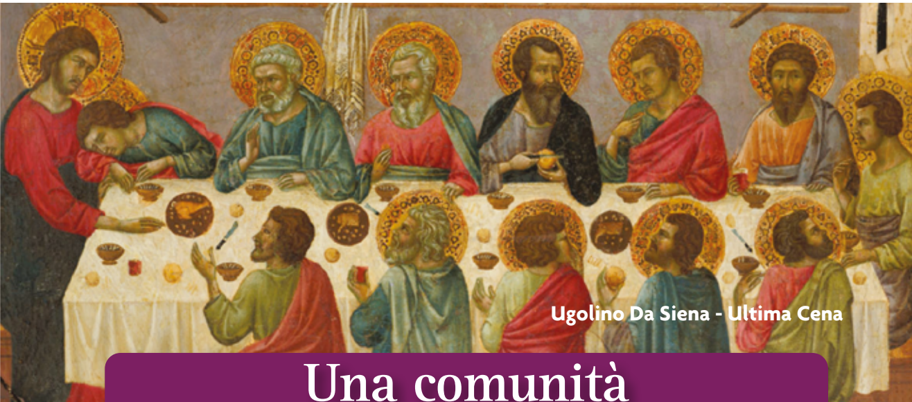
Ugolino Da Siena - Ultima Cena