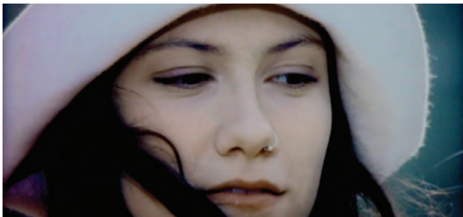
La cantante Elisa

Luce e tramonti a Nord-Est racconta di una donna che chiede al suo uomo di parlare, di comunicare sinceramente, senza barriere, una storia vissuta personalmente dalla stessa cantante. Nel testo si parla di due persone che hanno un progetto di vita insieme, ma poi capiscono che non si realizzerà. Nel creato, Elisa sembra trovare il bene e la luce che comunque quella relazione ha portato. In qualunque situazione ci si trovi per un credente è sempre possibile mantenere viva la gioia di esserci.