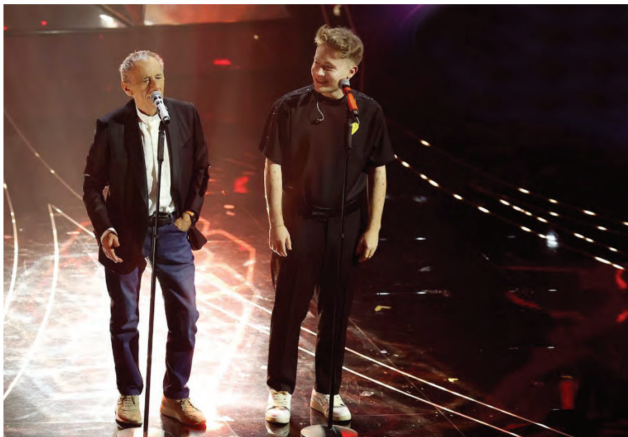
Roberto Vecchioni con il rapper Alfa

“Sogna ragazzo sogna” di Roberto Vecchioni è un invito a seguire sempre i propri sogni, non abbandonando la propria strada anche quando risulta tortuosa, rimanendo fedeli a ciò in cui si crede. Uno stimolo a non abbattersi anche quando tutto sembra andare per il verso sbagliato, perché se cerchiamo possiamo trovare l'amore in ogni cosa. Sognare non è quindi uno spreco di tempo, ma un modo per nutrire la speranza che è insita in ogni cuore e un aiuto a vivere in pienezza la vita a tal punto da divenirne poi testimoni credibili.