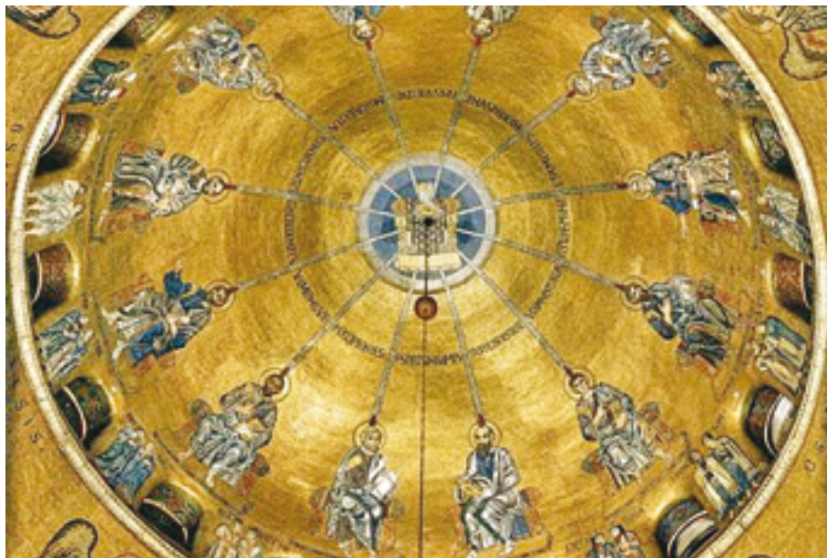
Cupola della Pentecoste - Basilica di San Marco, Venezia.

4 Io dico: camminate secondo lo Spirito e non adempirete affatto i desideri della carne. Perché la carne ha desideri contrari allo Spirito e lo Spirito ha desideri contrari alla carne; sono cose opposte tra di loro; in modo che non potete fare quello che vorreste. Ma se siete guidati dallo Spirito, non siete sotto la legge. Ora le opere della carne sono manifeste, e sono: fornicazione, impurità, dissolutezza, idolatria, stregoneria, inimicizie, discordia, gelosia, ire, contese, divisioni, sètte, invidie, ubriachezze, orge e altre simili cose; circa le quali, come vi ho già detto, vi preavviso: chi fa tali cose non erediterà il regno di Dio. Il frutto dello Spirito invece è amore, gioia, pace, pazienza, benevolenza, bontà, fedeltà, mansuetudine, autocontrollo; contro queste cose non c'è legge. Quelli che sono di Cristo Gesù hanno crocifisso la carne con le sue passioni e i suoi desideri. Se viviamo dello Spirito, camminiamo altresì guidati dallo Spirito.