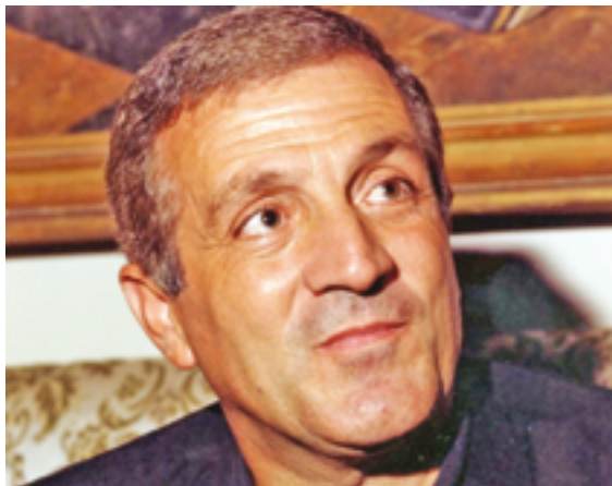
Don Tonino Bello

I verbi caratterizzanti il vero Amore usati da Paolo ci ricordano che si ama davvero l'altro quando vengono esercitate le virtù della pazienza e benevolenza, quando si gioisce, si spera insieme agli altri e si sopporta ogni cosa con serenità, cercando di coprire sempre il male con il bene e credendo fermamente nella bontà di Dio. L'amore