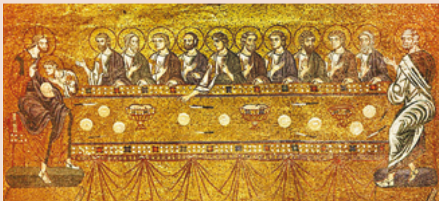
Venezia. Basilica di San Marco. Mosaico dell'Ultima Cena.

Se anche parlassi le lingue degli uomini e degli angeli, ma non avessi la carità, sono come un bronzo che risuona o un cembalo che tintinna. E se avessi il dono della profezia e conoscessi tutti i misteri e tutta la scienza, e possedessi la pienezza della fede così da trasportare le montagne, ma non avessi la carità, non sono nulla. E se anche distribuissi tutte le mie sostanze e dessi il mio corpo per esser bruciato, ma non avessi la carità, niente mi giova. La carità è paziente, è benigna la carità; non è invidiosa la carità, non si vanta, non si gonfia, non manca di rispetto, non cerca il suo interesse, non si adira, non tiene conto del male ricevuto, non gode dell'ingiustizia, ma si compiace della verità. Tutto copre, tutto crede, tutto spera, tutto sopporta. La carità non avrà mai fine. Le profezie scompariranno; il dono delle lingue cesserà e la scienza svanirà. La nostra conoscenza è imperfetta e imperfetta la nostra profezia. Ma quando verrà ciò che è perfetto, quello che è imperfetto scomparirà. Quand'ero bambino, parlavo da bambino, pensavo da bambino, ragionavo da bambino. Ma, divenuto uomo, ciò che era da bambino l'ho abbandonato. Ora vediamo come in uno specchio, in maniera confusa; ma allora vedremo a faccia a faccia. Ora conosco in modo imperfetto, ma allora conoscerò perfettamente, come anch'io sono conosciuto. Queste dunque le tre cose che rimangono: la fede, la speranza e la carità; ma di tutte più grande è la carità!