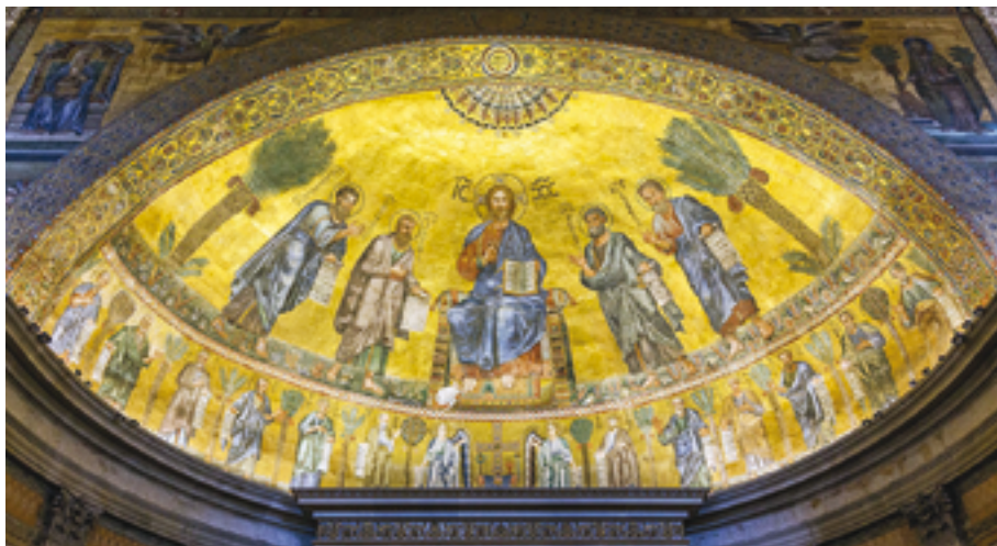
Cristo con gli Apostoli Pietro, Andrea e Paolo e Luca, particolare Mosaico absidale. Roma, Basilica di San Paolo fuori le Mura.

Perciò anch'io, avendo avuto notizia della vostra fede nel Signore Gesù e dell'amore che avete verso tutti i santi, continuamente rendo grazie per voi ricordandovi nelle mie preghiere, affinché il Dio del Signore nostro Gesù Cristo, il Padre della gloria, vi dia uno spirito di sapienza e di rivelazione per una profonda conoscenza di lui; illumini gli occhi del vostro cuore per farvi comprendere a quale speranza vi ha chiamati, quale tesoro di gloria racchiude la sua eredità fra i santi e qual è la straordinaria grandezza della sua potenza verso di noi, che crediamo, secondo l'efficacia della sua forza e del suo vigore. Egli la manifestò in Cristo, quando lo risuscitò dai morti e lo fece sedere alla sua destra nei cieli, al di sopra di ogni Principato e Potenza, al di sopra di ogni Forza e Dominazione e di ogni nome che viene nominato non solo nel tempo presente ma anche in quello futuro.