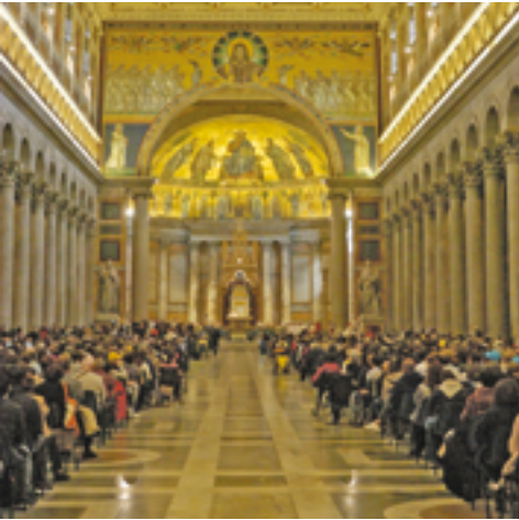
Basilica di San Paolo fuori le mura, celebrazione eucaristica presieduta da S.E. Mons. Rino Fisichella

Pertanto, la dimensione spirituale del Giubileo, che invita alla conversione, si coniughi con questi aspetti fondamentali del vivere sociale, per costituire un'unità coerente. Sentendoci tutti pellegrini sulla terra in cui il Signore ci ha posto perché la coltiviamo e la custodiamo (cfr Gen 2,15), non trascuriamo, lungo il cammino, di contemplare la bellezza del creato e di prenderci cura della nostra casa comune.