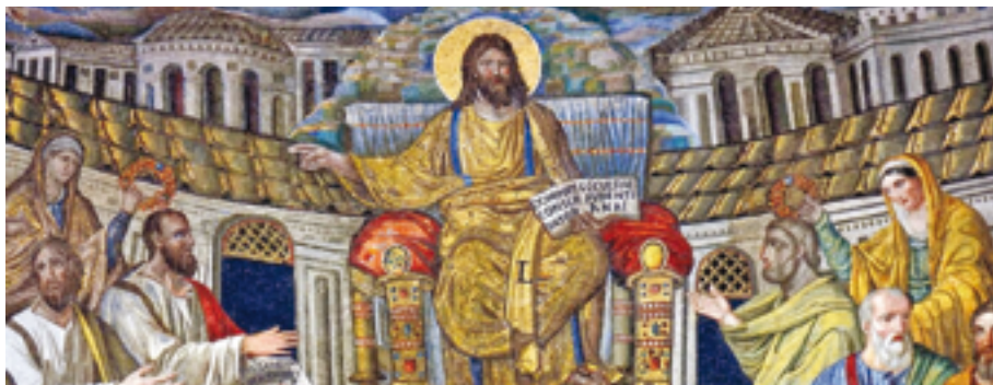
Cristo in trono, fine IV sec. Mosaico. Roma, Basilica di Santa Pudenziana.

E voi avete seguito il nostro esempio e quello del Signore, avendo accolto la Parola in mezzo a grandi prove, con la gioia dello Spirito Santo, così da diventare modello per tutti i credenti della Macedonia e dell'Acacia. Infatti per mezzo vostro la parola del Signore risuona non soltanto in Macedonia e in Acacia, ma la vostra fede in Dio si è diffusa dappertutto, tanto che non abbiamo bisogno di parlarne. Sono essi infatti a raccontare come noi siamo venuti in mezzo a voi e come vi siete convertiti dagli idoli a Dio, per servire il Dio vivo e vero e attendere dai cieli il suo Figlio, che egli ha risuscitato dai morti, Gesù, il quale ci libera dall'ira che viene.